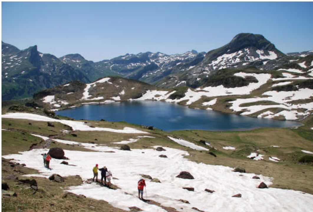
Foto ganadora del I concurso de fotografía de senderismo. Midi D'ossau.